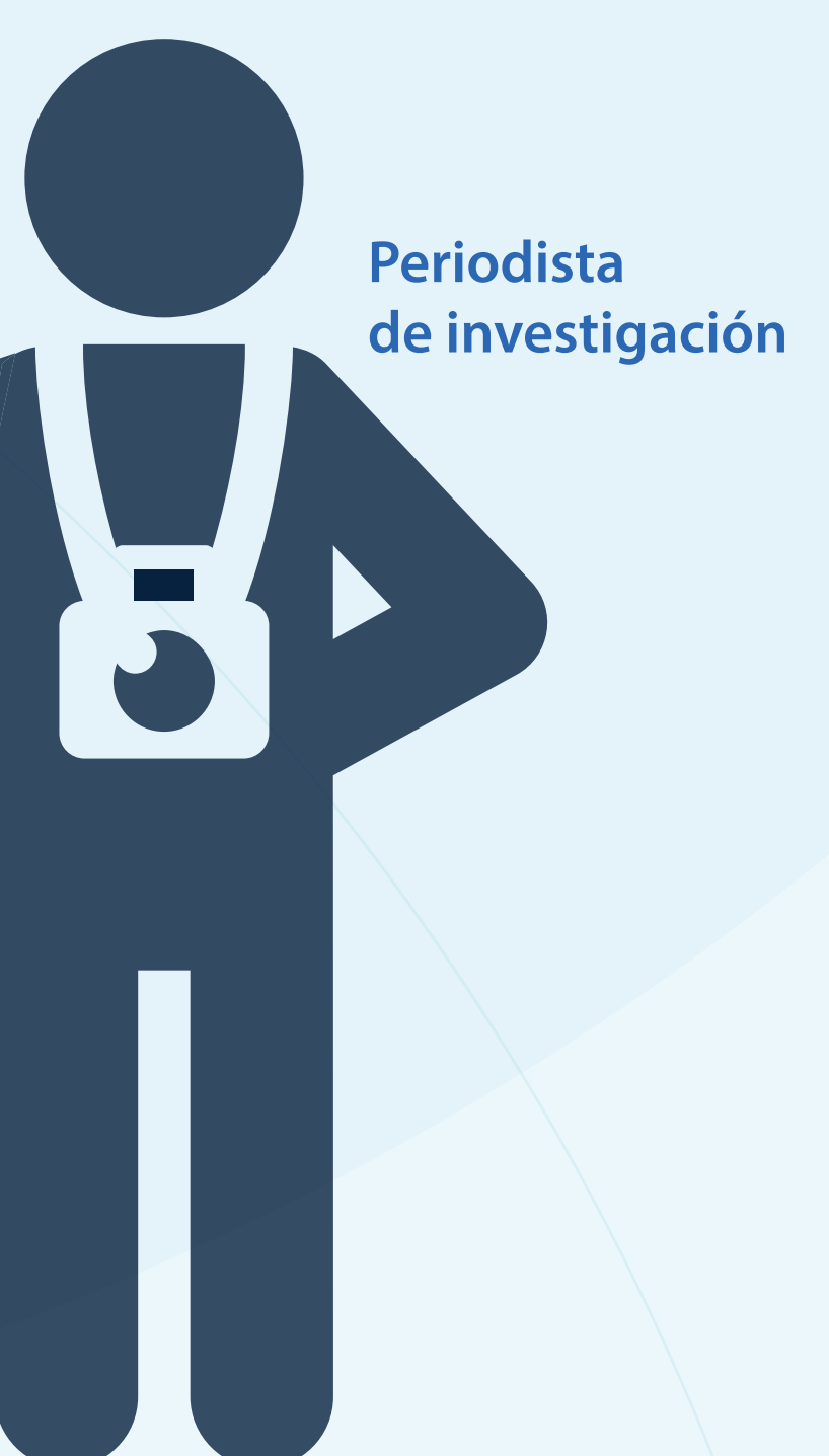
Periodista de investigación